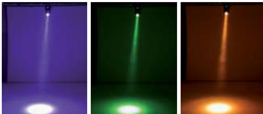
Beam-Abstrahlung beim Eurolite TMH X1